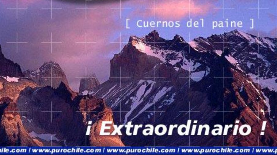
[ Cuernos del Paine ]