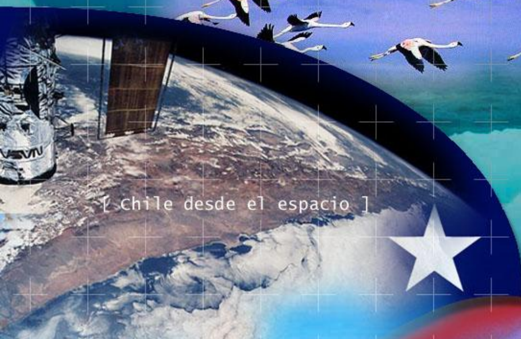
[ Chile desde el espacio ]