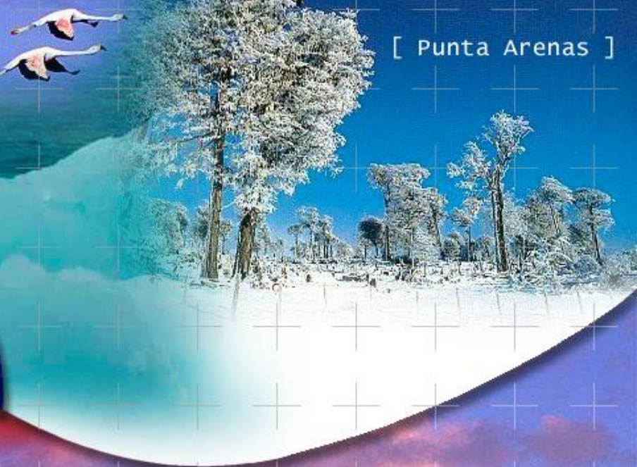
[ Punta Arenas ]