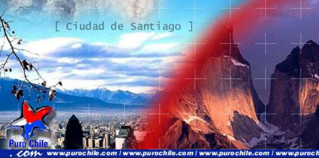
[ Ciudad de Santiago ]